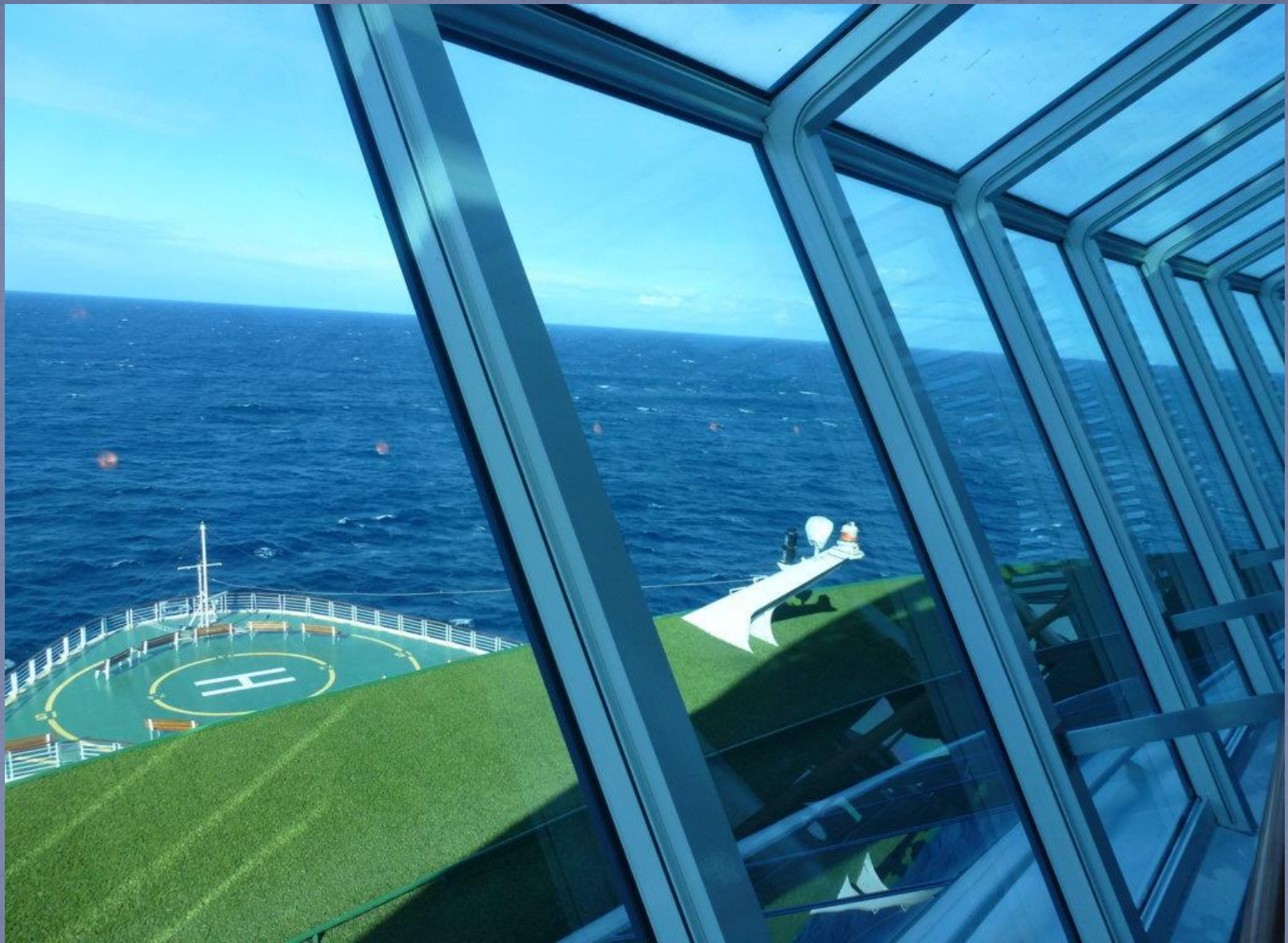
Eine der schönsten Bars befindet sich vorn am Bug. Rundumsicht wie auf der Brücke. Hier war der beste Platz für die Durchfahrt der Inside-Passage.