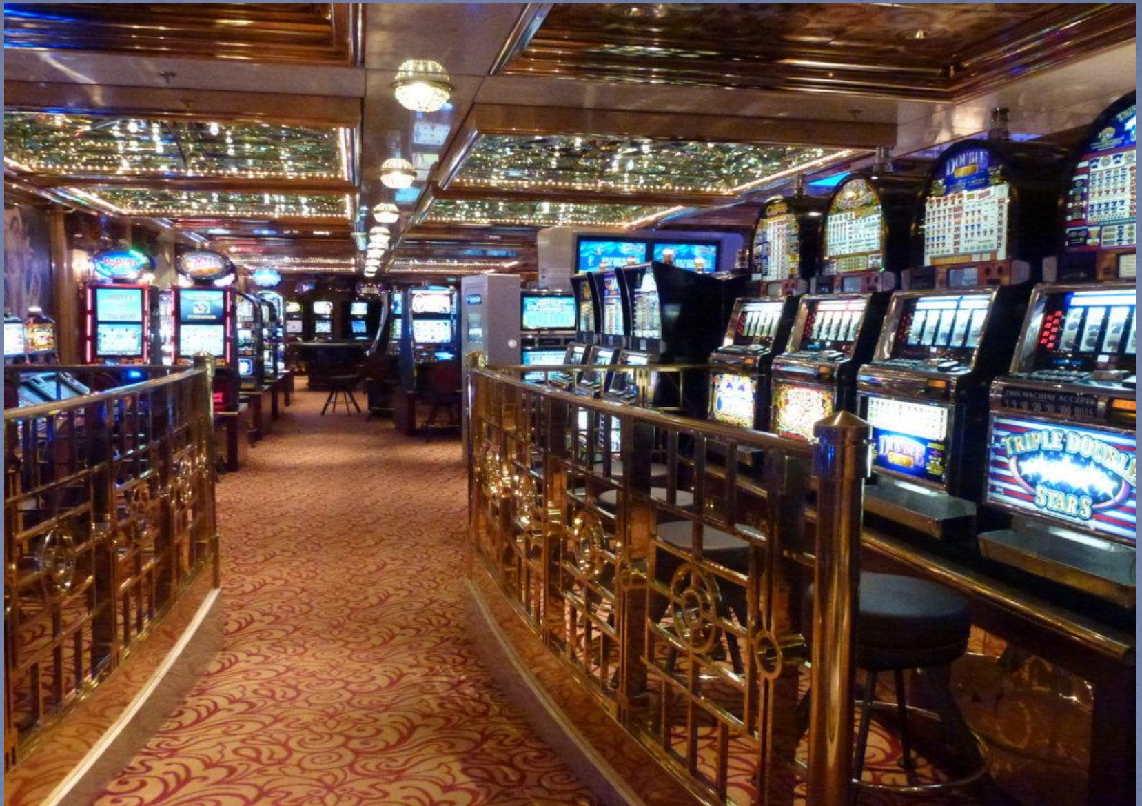
Auf amerikanischen Kreuzfahrtschiffen ist ein üppiger Spielcasino-Bereich üblich.