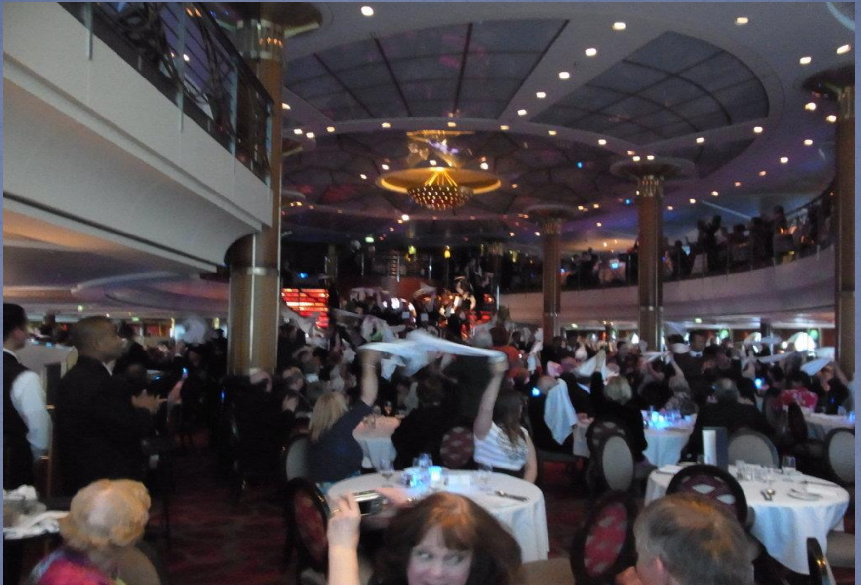
Das Farewell-Dinner wird zu einem italienischen Abend. Das Restaurant- und Küchenpersonal zieht in einer Polonaise durch den stilvollen Speisesaal.