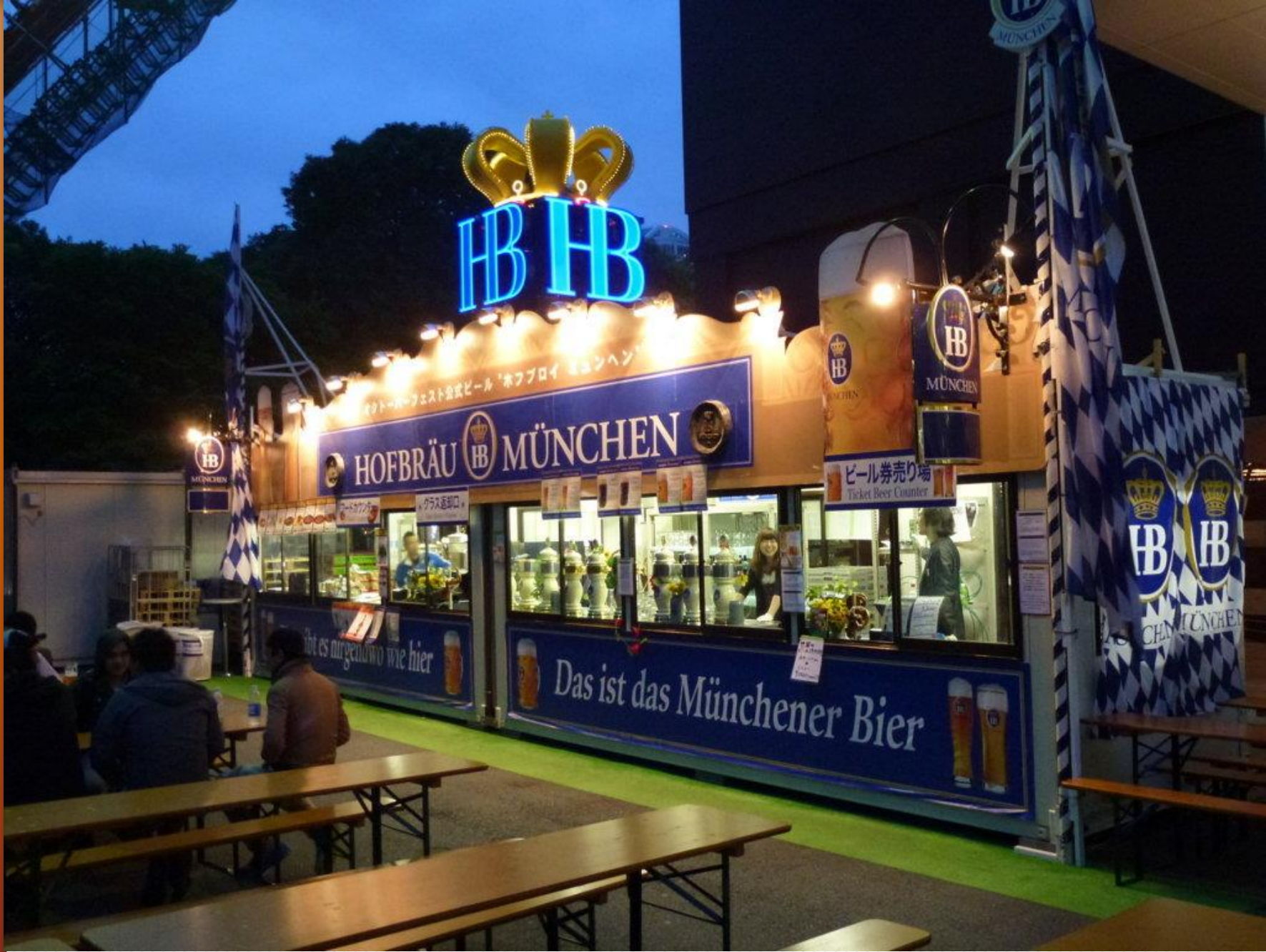
In Tokio entscheiden wir uns für eine Stadtrundfahrt zum Tokyo-Tower. Direkt vor der Tür entdecken wir einen Hofbräuhaus-Bierausschank. Die Japaner haben doch eine Seelenverwandtschaft mit uns. Es ist fast wie zuhause.