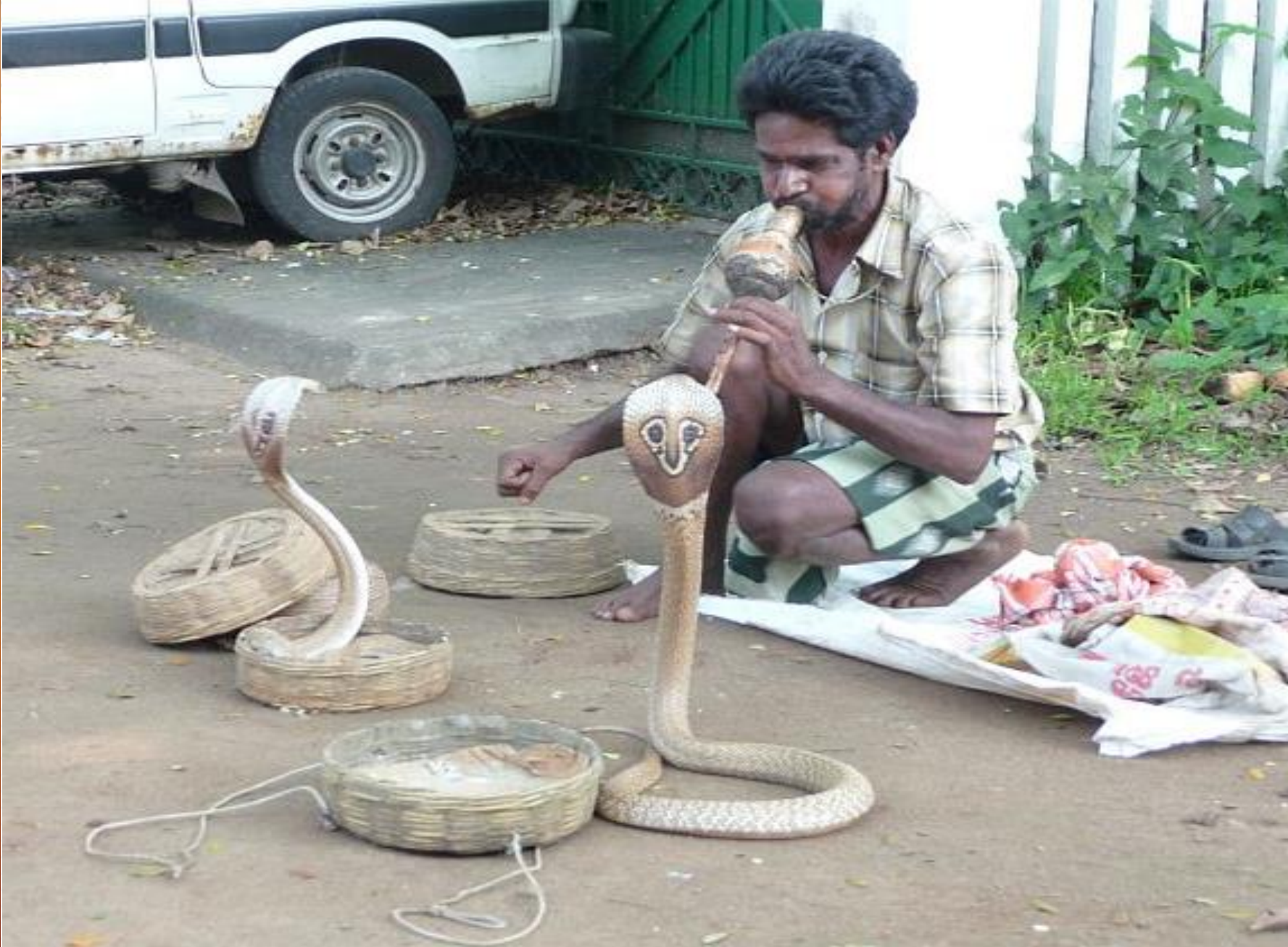
Der Tanz der Kobras ist sicher kein ganz ungefährliches Schauspiel...