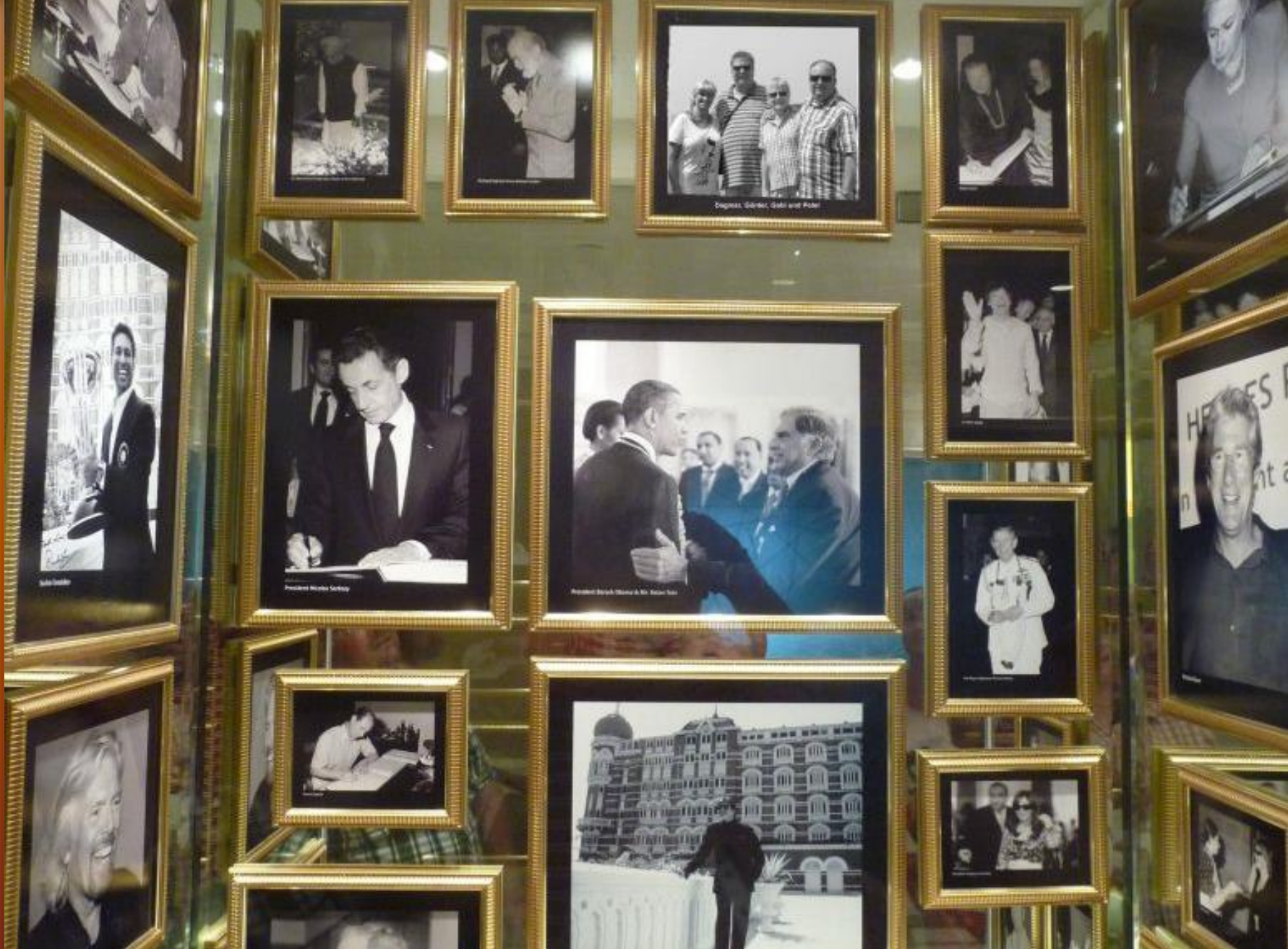
Das Taj Mahal Palace hat im Flur eine ausgedehnte Fotogalerie seiner berühmtesten Gäste. Wer entdeckt den kleinen Scherz?