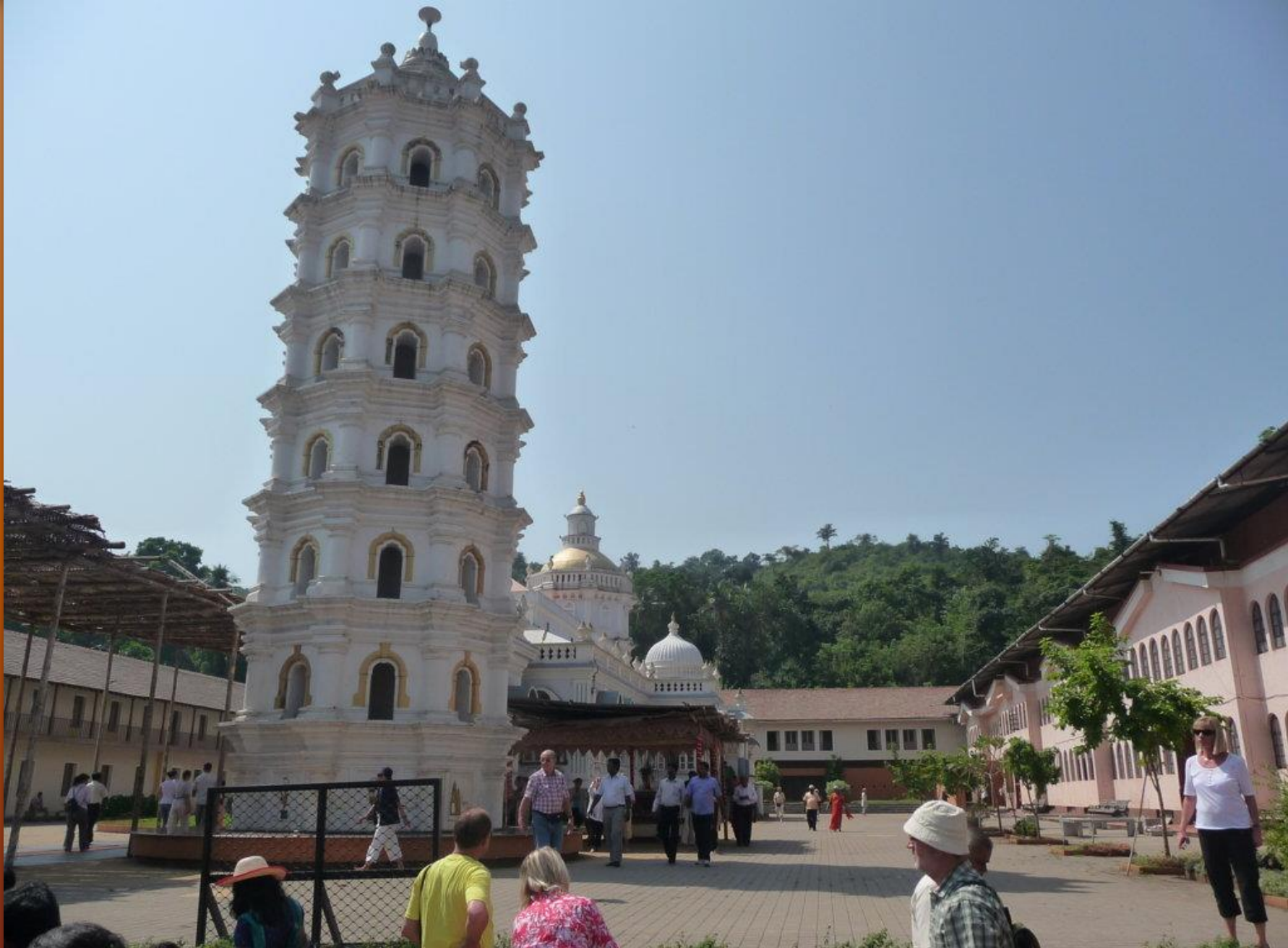
Der Mangueshi-Tempel hat etwas vom schiefen Turm zu Pisa.