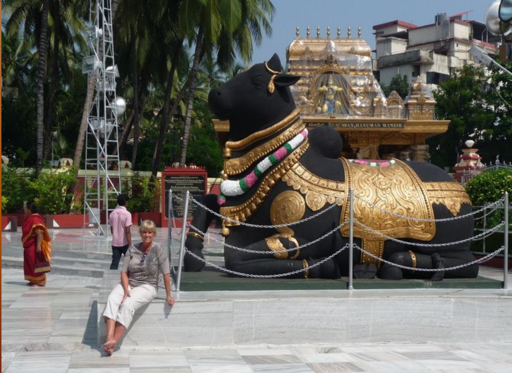
Vor der heiligen Kuh machen wir noch schnell ein Erinnerungsfoto, bevor es in den Tempel geht.